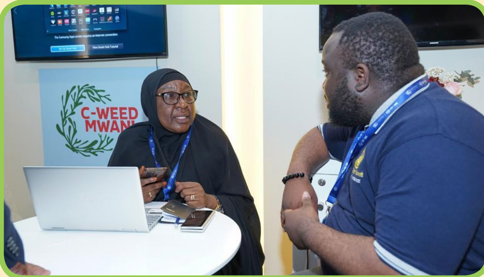
Wataalamu kutoka Ofisi ya Makamu wa Rais wakitoa maelezo kuhusu masuala mbalimbali kwa wananchi waliotembelea banda la Tanzania - B86 katika Viwanja vya Dubai Expo City, Dubai - Umoja wa Falme za Kiarabu (UAE)