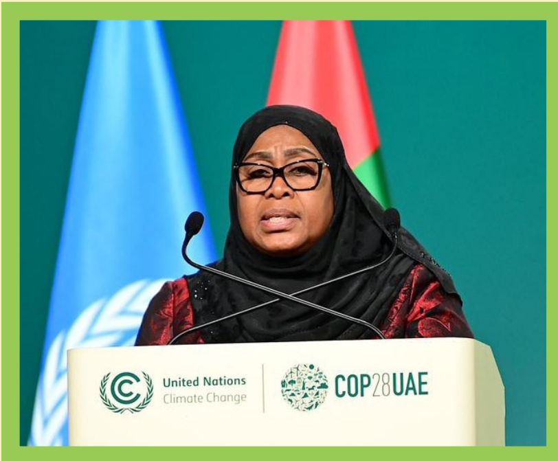
Rais wa Jamhuri ya Muungano wa Tanzania Mhe. Dkt. Samia Suluhu Hassan akizungumza kwenye Mkutano wa Umoja wa Mataifa wa Mabadiliko ya Tabianchi (COP28) uliofanyika Dubai katika Falme za Kiarabu Desemba 01, 2023.