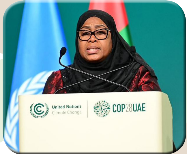
Rais Samia ahimiza upatikanaji fedha miradi mabadiliko tabianchi Uk. 5