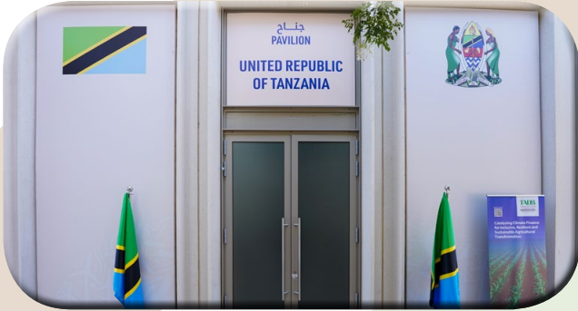
Msimamo wa Tanzania katika Mkutano wa COP28 Uk. 4