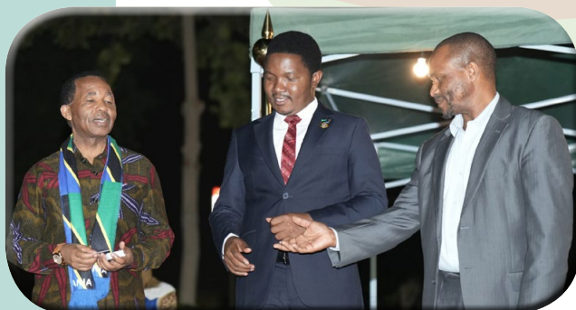
'Serikali imewawekea Diaspora mazingira mazuri ya kazi' Uk. 14