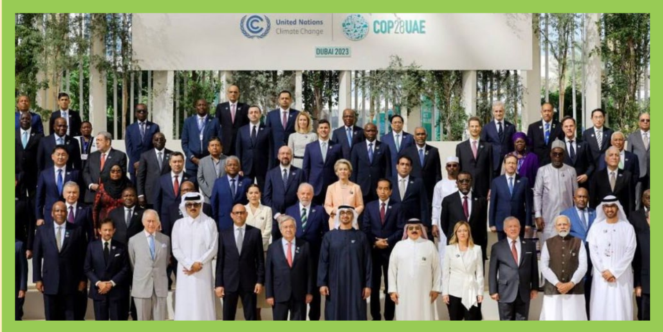
Rais wa Jamhuri ya Muungano wa Tanzania Mhe. Dkt. Samia Suluhu Hassan (wa pili kushoto - msiari wa tatu kutoka mbele) akiwa katika picha ya pamoja na Wakuu wa Nchi na Serikali katika ufunguzi wa Mkutano wa COP28 uliofanyika Dubai, Umoja wa Falme za Kiarabu (UAE) kuanzia tarehe 30 Novemba — 12 Desemba, 2023

K atika mkutano wa majadiliano ngazi ya Wataalamu Ofisi ya Makamu wa Rais kwa kushirikiana na Wizara za kisekta, sekta binafsi na Asasi za Kiraia ilitatibu kuwasilisha na kutoa mwongozo wa majadiliano ya kitaalamu kupitia msimamo wa Nchi wa mkutano wa 28 ambao iliandaa.