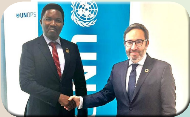
Dkt. Jafo aishukuru UNOPS kuisaidia Tanzania miradi ya mabadiliko ya tabianchi Uk. 7