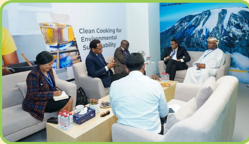
Waziri wa Kilimo Mhe. Hussein Bashe akishiriki mkutano wa pembezoni wakati wa Mkutano wa 28 wa Nchi Wanachama wa Mkataba wa Umoja wa Mataifa wa Mabadiliko ya Tabianchi (COP 28) ulioanza Novemba 30 hadi Desemba 12, 2023.