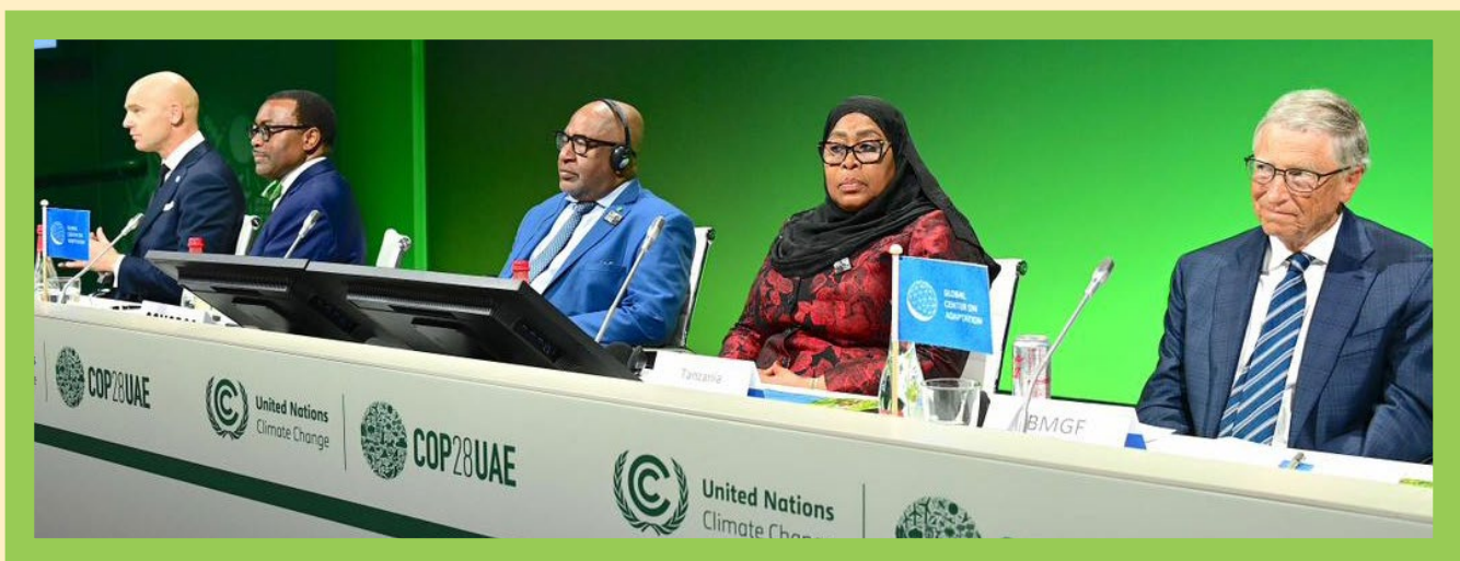
Rais wa Jamhuri ya Muungano wa Tanzania Mhe. Dkt. Samia Suluhu Hassan akiwa pamoja na viongozi mbalimbali wakati wakishiriki moja ya Mikutano kando ya Mkutano wa Umoja wa Mataifa wa Mabadiliko ya Tabianchi (COP28) uliofanyika Dubai, Umoja wa Falme za Kiarabu, Desemba 01, 2023.

Akisisitiza kwenye mkutano huo, Rais Samia amesema Tanzania ina nia ya kuhamasisha kuongezwa matumizi ya nishati safi na gharama nafuu ya kupikia na teknolojia kote barani Afrika, hasa kwa wanawake.